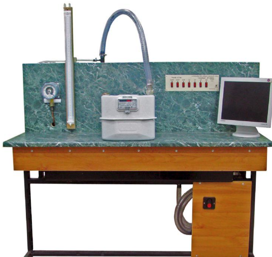
Рисунок 1 – Общий вид

Архангельск (8182)63-90-72 Астана (7172)727-132 Астрахань (8512)99-46-04 Барнаул (3852)73-04-60 Белгород (4722)40-23-64 Брянск (4832)59-03-52 Владивосток (423)249-28-31 Волгоград (844)278-03-48 Вологда (8172)26-41-59 Воронеж (473)204-51-73 Екатеринбург (343)384-55-89 Иваново (4932)77-34-06