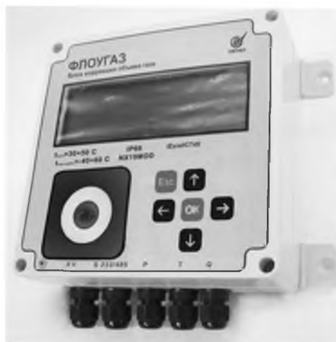
Рисунок 1. Общий вид блока коррекции объема газа «ФЛОУГАЗ».

Вычислитель микропроцессорный представляет собой микроЭВМ, выполненную на базе современной микропроцессорной технологии, позволяющей производить с высокой точностью измерение требуемых параметров, проведение вычислений, а также хранение и вывод информации на внешние устройства.